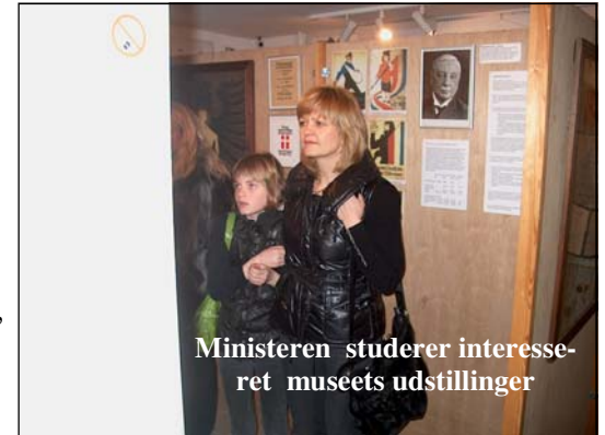
Ministeren studerer interesseret museets udstillinger

“For det første var valget af steder, der skulle besøges gjort ud fra, at de er drevet af frivillige mennesker. Lokale ildsjæle, der brænder for sagen, og for hvem der stort set ikke findes noget vigtigere end netop deres museum. Et engagement og indsats, som måske kan