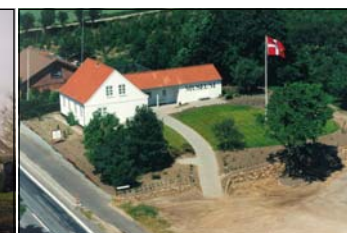
10. juli 1995