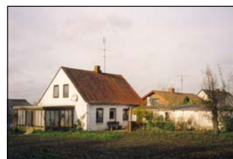
1. januar 1995