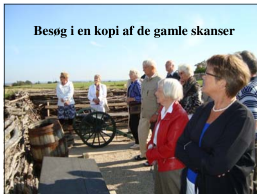
Besøg i en kopi af de gamle skanser