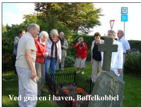
Ved graven i haven, Bøffelkøbbel