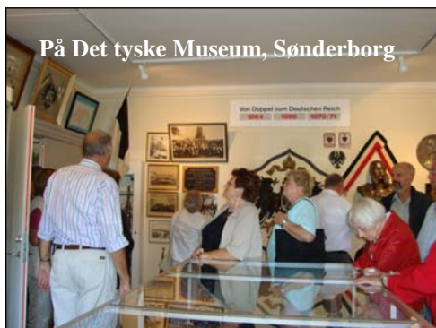
På Det tyske Museum, Sønderborg