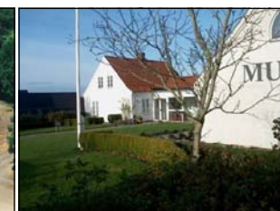
10. juli 2009